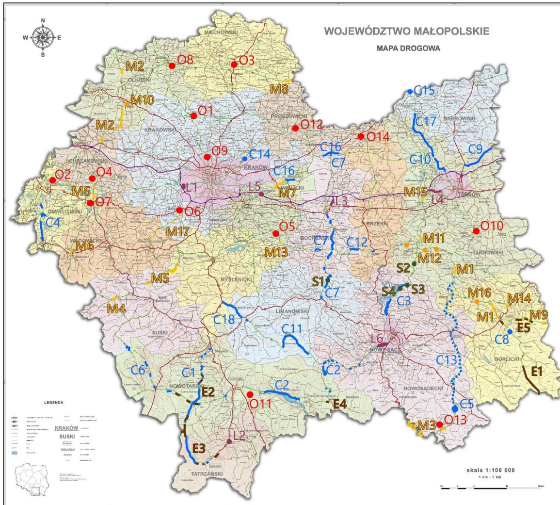
Rys.2. Planowane inwestycje drogowe w Małopolsce do roku 2023.