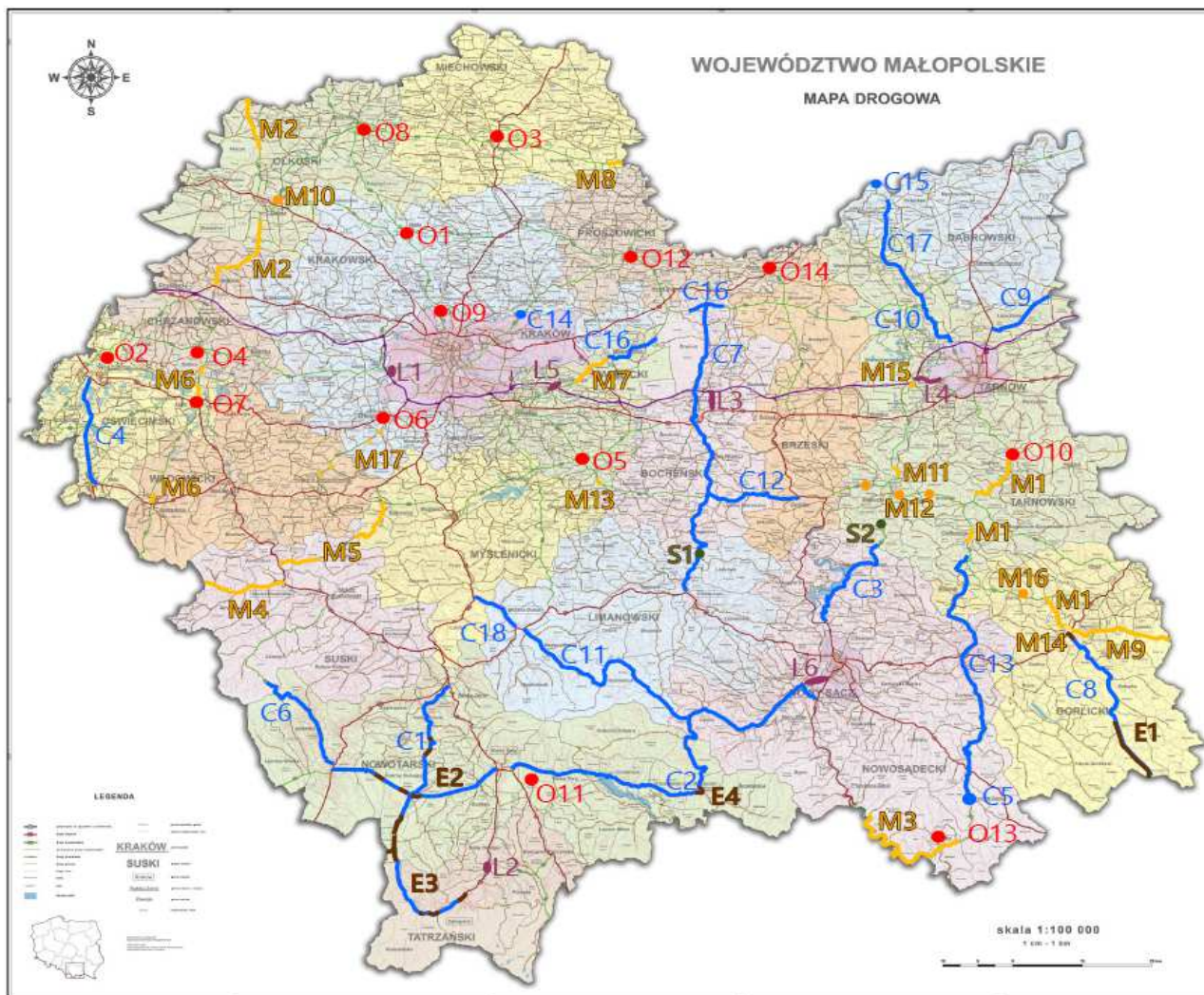
Rys.2. Planowane inwestycje drogowe w Małopolsce do roku 2023.